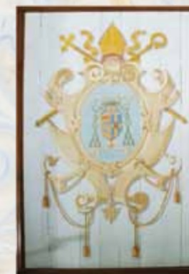
Armoiries XX e siècle Jésus»

Le plafond inférieur en forme de carène de bateau renversée est la marque de cette époque où les charpentiers étaient issus de la marine.