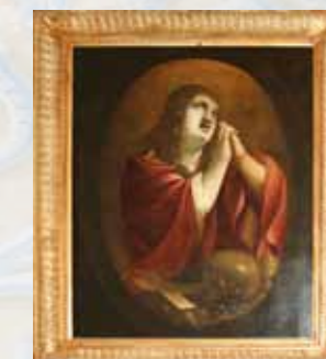
Sainte Marie-Madeleine XVII e -XVIII siècle (98x85cm)

In the 17th and 18th century, many repairs were undertaken.