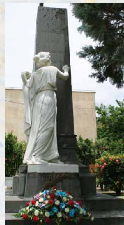
Monument aux morts

The cemetery Where many slaves were buried was located opposite the church. Nowadays, there is the Memorial standing up on this spot.