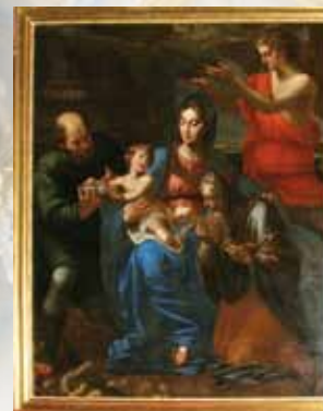
La Sainte-Famille Fin du XVIII e - début du XIX e siècle Huile sur toile (2,32 x 1,89m)

En 1903, à nouveau en très mauvais état, des travaux seront exécutés, le lambrissage et la voûte de l'église furent remis à neuf et elle fut repeinte.